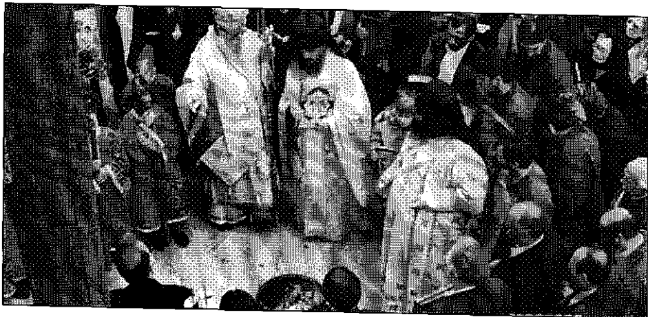
Εἰς τὴν Ἱερὰν Μητρόπολιν Κοζάνης