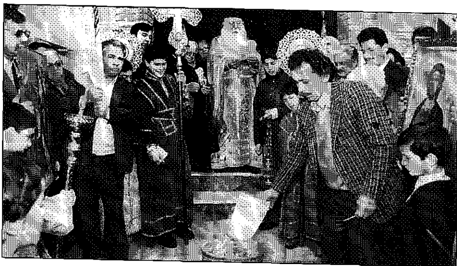
Εἰς τὴν Ἱερὰν Ἀρχιεπισκοπὴν Γ.Ο.Χ. Ἀθηνῶν