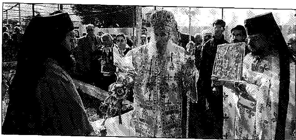
Εἰς τὴν Ἱερὰν Μητρόπολιν Μεσσηνίας