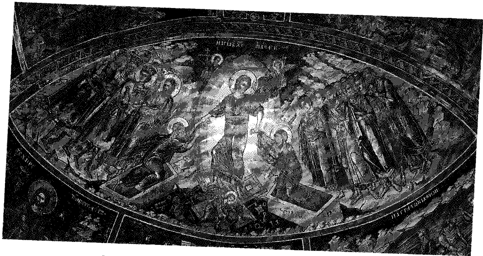
«Η ΑΓΙΑ ΤΟΥ ΧΡΙΣΤΟΥ ΑΝΑΣΤΑΣΙΣ» Τοιχογραφία ἐκ τοῦ Μεγάλου Μετεώρου. Αὕτη ἡ τοιχογραφία εἶναι διὰ τοὺς πέντε «αἰρετικὴ» καὶ τὴν «ἀναθεμάτισαν»!!!