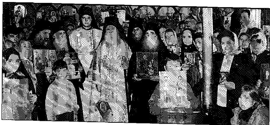
Εἰς τὴν Ἱερὰν Μητρόπολιν Φθιώτιδος