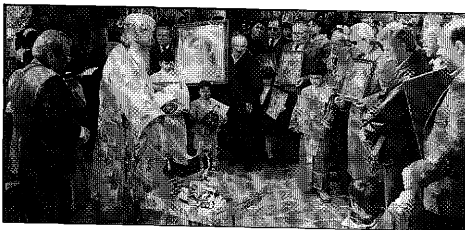
Εἰς τὴν Ἱερὰν Μητρόπολιν Ἀττικῆς