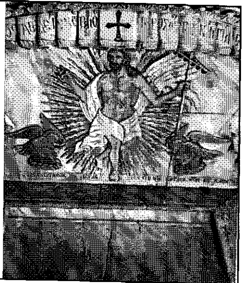
Άνω: Ψηφιδωτά εικόνες από «δωδεκάθεον» τών αρχών του 14ου αιώνας (Φλωρεντία). Εικονίζονται η Βασιφόρος, ή Σταύρωσις, ή Ανάστασις, και η ανάληψις. Κατά τούς πέντε είναι «αιρετική» και την έχουν «ανάθεματίσει!» διότι έχει την Βυζαντινή εικόνα της Ανάστασις και όχι την εκ τάφου έγερσιν! (Παγκόσμιος Ιστορία Τέχνης, Εκδοτικός Οργανισμός «Χρυσός Γίγας» Α.Ε.). Κάτω: Αι «ορθόδοξοι» εικόνες της «εκ τάφου Έγέρσεως τας όποιαις αποκλειστικώς ήθελον νά επιβάλουν εις την Έκκλησία οι πέντε! Άριστερά: Σηβλιανος Πρωφ. ήλιου, όρος Χωραφ, Σινά 1855. Δεξιά: Από τόν Πανάγιο Τάφο εις τά Ιερουσόλυμα.